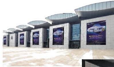
◀ 6号馆北面墙体广告