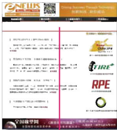
2 e-News电子新闻期刊横幅广告 (宣传效果★★★★★)