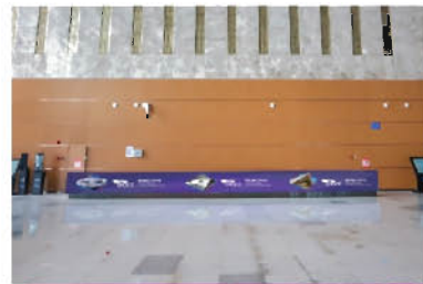
B区北登陆大厅咨询台