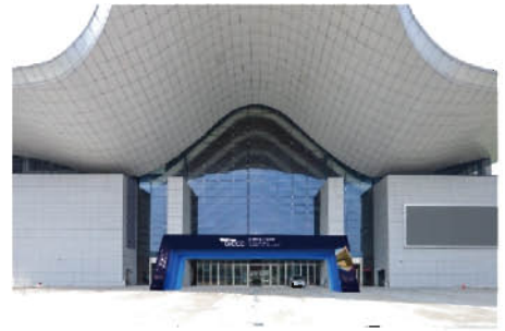
B区北登陆大厅广场 ▲