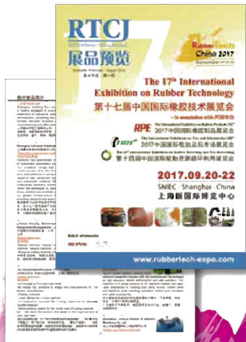
3 《展品预览》电子刊物彩页广告 (宣传效果★★★★☆)