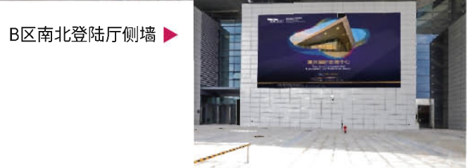
▶ B区南北登陆厅侧墙