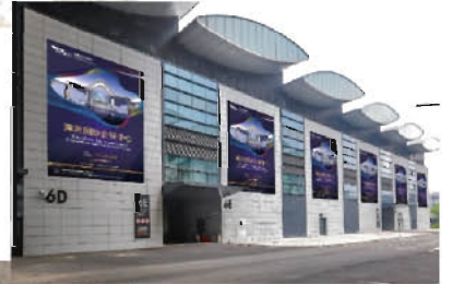
▶ 6号馆南面墙体广告