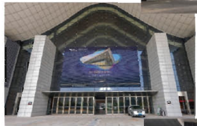
◀ B区南北登陆厅玻璃墙