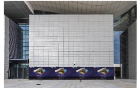
▲ B区北登陆大厅广场