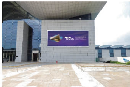
B区南北登陆厅户外LED屏